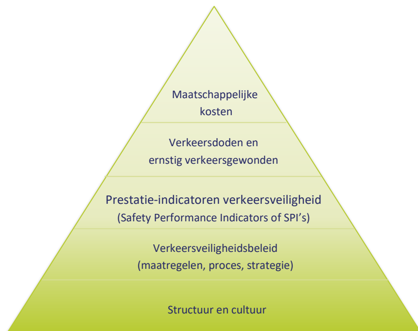
Afbeelding 1. De verkeersveiligheidspiramide (naar Koonstra et al., 2002; LTSA, 2000) gerelateerd aan de vijf niveaus van de benchmark voor verkeersveiligheid.

Deze vijf niveaus kunnen gerelateerd worden aan de verschillende lagen van de verkeersveiligheidspiramide (Koonstra et al., 2002; LTSA, 2000). De piramide staat in Afbeelding 1 . Bovenaan staan de maatschappelijke kosten. Dit zijn kosten die de maatschappij moet dragen voor bijvoorbeeld medische behandelingen, arbeidsongeschiktheid of immateriële kosten van verkeersslachtoffers. De verkeersslachtoffers (het aantal verkeersdoden en ernstig verkeersgewonden) vormen de tweede laag. Deze verkeersslachtoffers zijn gerelateerd aan laag drie: de prestatie-indicatoren voor verkeersveiligheid, bijvoorbeeld de fietsinfrastructuur en de snelheid. Deze indicatoren worden beïnvloed door de vierde laag van de piramide: het verkeersveiligheidsbeleid. De onderste laag, structuur en cultuur, is van invloed op het budget voor verkeersveiligheid en verkeersveiligheidsdoelstellingen.